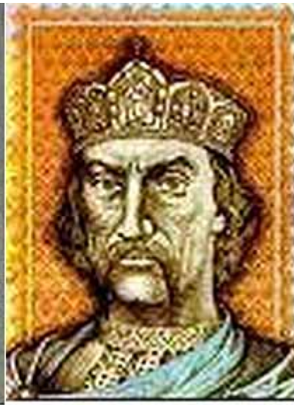
Wladimir der Heilige, Großfürst von Kiew

Fälschlicherweise hielt man Jaroslaw's Bruder als Stammvater des Geschlecht aber die von Freiherr v. Taube veröffentlichte Untersuchung (1940) zeigt auf eine im 16ten Jahrhundert angedichtete Sage. Der echte Ursprung soll danach in Kiew bei den Galizischen Fürsten liegen.